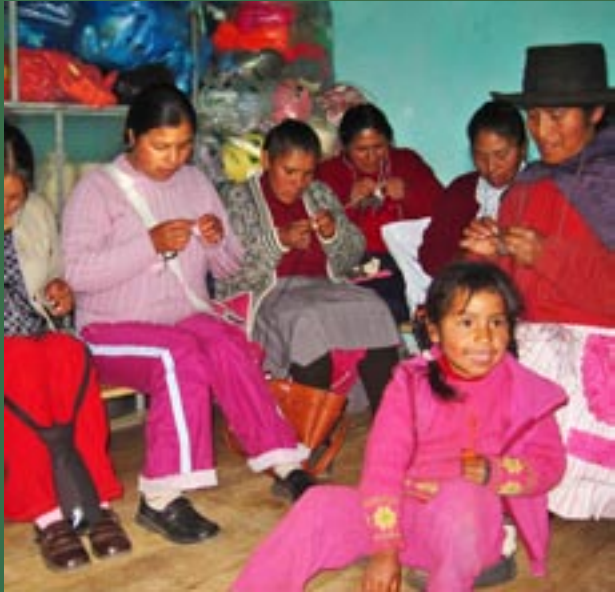
Tejiendo: miembros de El Mucurio trabajan duras

4.- desarrollo de mercados.- promover mercados (nacional e internacional) para buscar la sostenibilidad de los talleres de productores y del proceso de comercio justo.